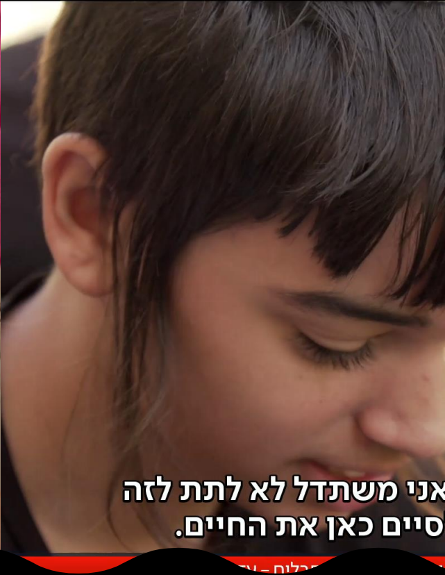
הם עוד פה כאילו.