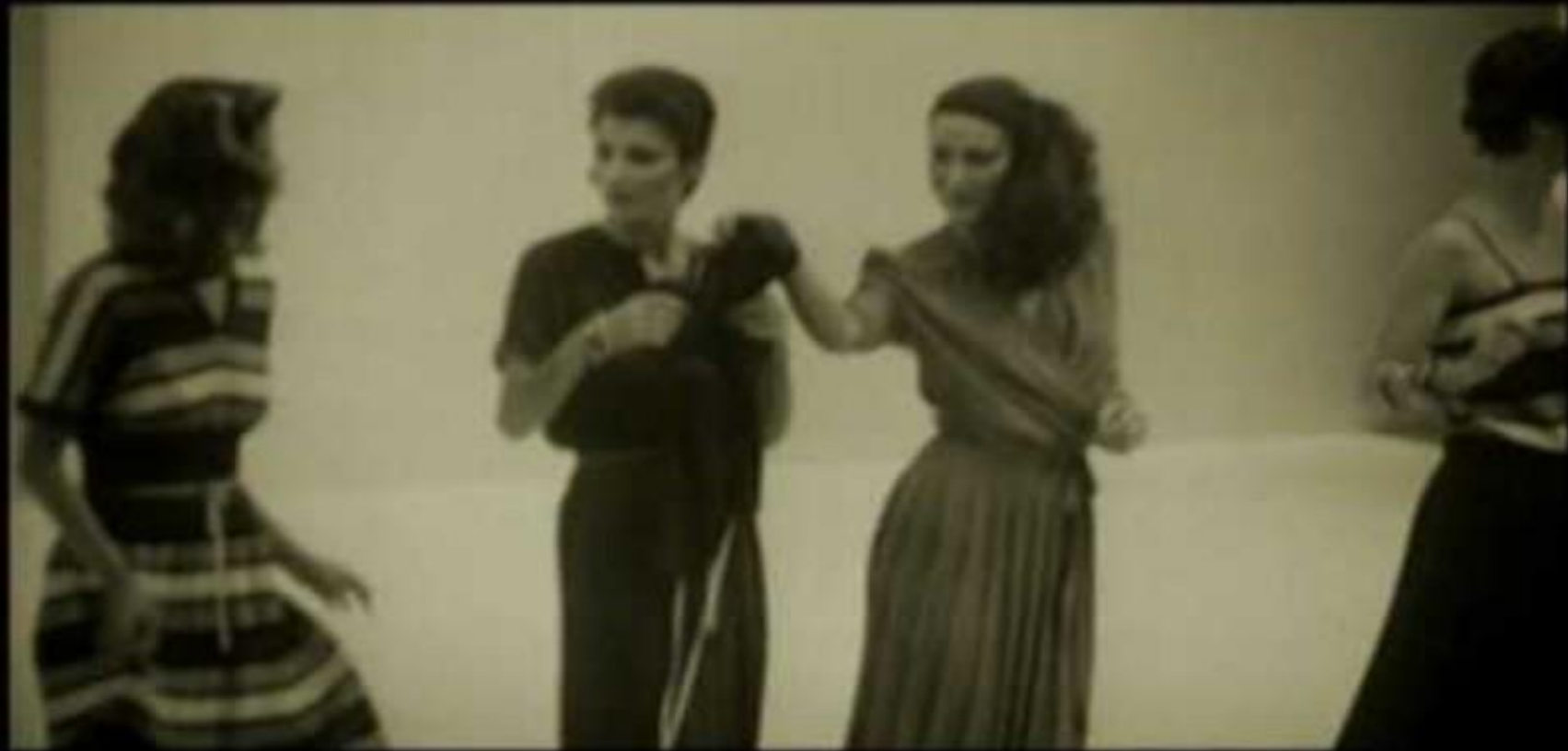
אין בה נחמה

Watch Full Movie - / פילמדי - תולדות האופנה הישראלית - צו האופנה ( movie-discovery.com דיסקברי)